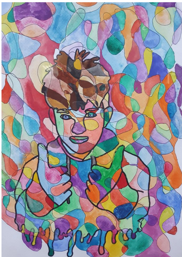
To sem jaz.